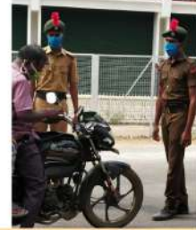
East police station vehicle check:30.04.2020