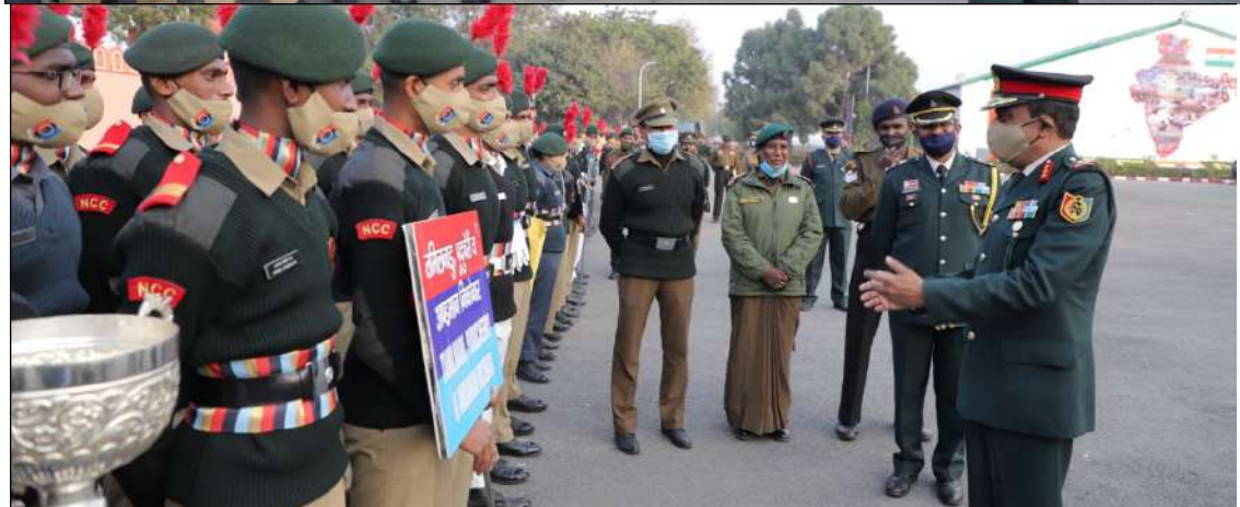
NCC REPUBLIC DAY CAMP & PM'S RALLY 2021 @ NEW DELHI NCC DIRECTORATE TAMIL NADU, PONDICHERY & ANDAMAN NICOBAR CONTINGENT