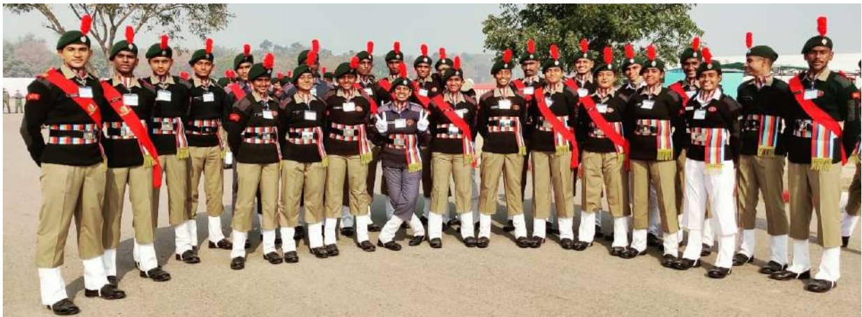
NCC REPUBLIC DAY CAMP & PM'S RALLY 2021 @ NEW DELHI NCC DIRECTORATE TAMIL NADU, PONDICHERRY & ANDAMAN NICOBAR CONTINGENT